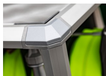
Designabdeckkappen für Eckverbinder