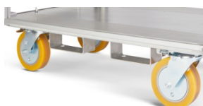
Aufnahme für Transport mit Stapler