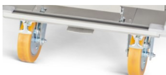
Geradauslauffeststeller für Lenkrollen